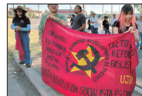
entre otras demandas ante la ausencia oficial de las que nos representan como autoridades . ©