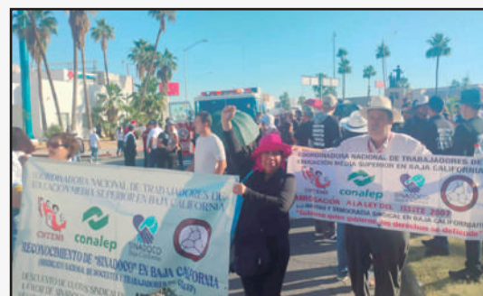
Sinadoco Delegación Baja California en el Desfile Obrero en Mexicali 01 de Mayo de 2026

El Sindicato Nacional de Docentes al Servicio de Conalep, Delegación Baja California (SINADOCO Baja California) estuvo presente en el desfile obrero del viernes 01 de mayo en el Centro Cívico de Mexicali. SINADOCO es un sindicato libre y democrático, formado por los Maestros y Docentes del Colegio Nacional de Educación Profesional Técnica (CONALEP) estado presente en 18 estados de la República y naturalmente donde se incluye Baja California. Existen Maestros adheridos al SINADOCO Baja California en los Planteles Tijuana I, Tijuana II,