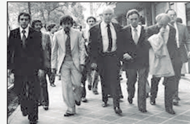
Aquel atentado a la libertad de Expresión cierre de Excelsior 1976 Ciudad de México, fecha significativa en el periodismo mexicano.

Fue en 1991 cuando el Comité de Protección a Periodistas (CPJ) por sus siglas en inglés determinó un 03 de mayo como el "Día de la Libertad de Expresión" esto a nivel mundial. Esta fecha es emblemática debido a que en Nueva York un periodista fue asesinado, después de una prolongada investigación donde había una injusticia por parte de las autoridades policíacas de Nueva York contra un ciudadano. Simultáneamente tanto en Sudamérica como en África, reporteros fueron asesinados cumpliendo con su trabajo de llevar la información a sus medios informativos. En nuestro México lindo y querido, existe otra fecha para el festejo de los trabajadores de la información: el 07 de junio. Esta fecha se origina allá en el sexenio del entonces Presidente Miguel Alemán Valdés, ya que ese día y en un año de su sexenio la entonces Cadena Periodista "García Valseca" le otorgó una comilona a la entonces Secretaria de Prensa de la Presidencia de la República. Esto por la excesiva publicidad para aquella cadena de diarios y que en la actualidad es la organización Editorial Mexicana (OEM) que fundó el extinto potentado, Mario Vázquez Raña. En Baja California, la represión a la libertad de prensa ha sido violada, por ejemplo aquel 01 de noviembre de 1979, cuando aquel combativo vespertino "ABC" de