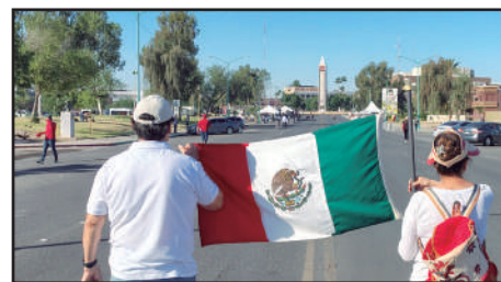
cali, las colectoras de búsqueda de desaparecidos, entre otros grupos sociales.