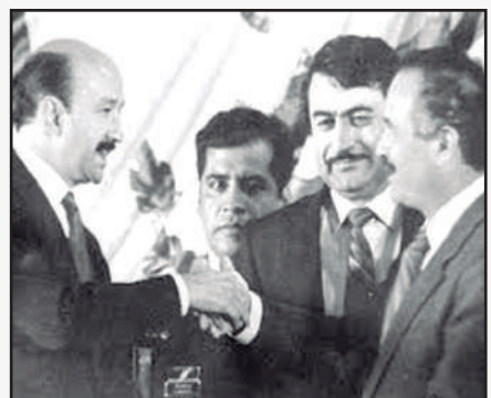
Elecciones julio 1989, el PAN con Ruffo gana Gubernatura por primera vez en la Historia

en la cual participé como Consejero Electoral. ¿Para la próxima elección del mes de julio de 2027, cambiará la conducta de los candidatos a elección popular en general? No lo creo, ¿Usted?